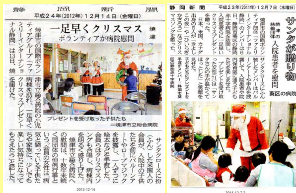
国際ボランティア団体「ファミリーインターナショナル静岡」活動の様子

当教室の講師は英語教育を 10年以上経験したプロのみです。 熱い講師陣に加え、国際ボラン ティア団体「ファミリーインタナ ショナル静岡」の協力もあり、 20年以上にわたり日本で英語活 動を行う外国人講師によるネイ ティブレッスンも開講しました。